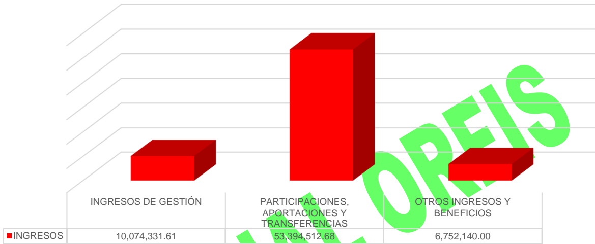
Gráfico 1. Ingresos